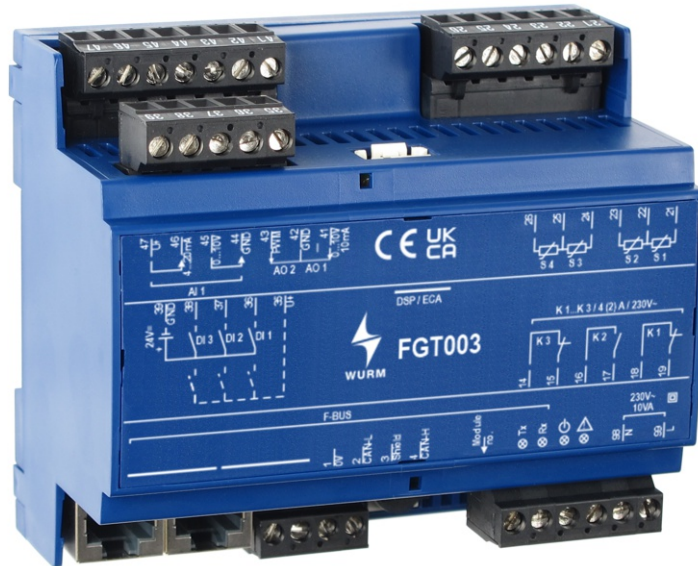
Abb. 1: Frontansicht