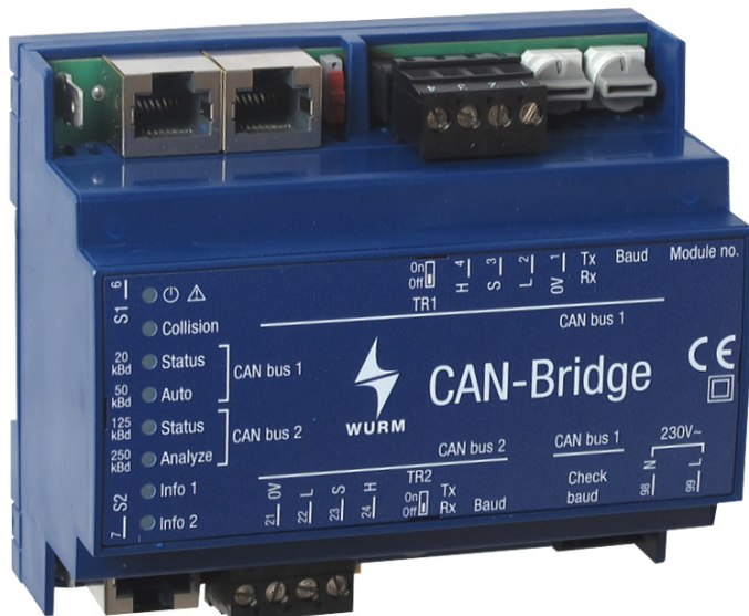
Abb. 1: Frontansicht CAN-Bridge